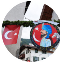
Rione Turchia (Türk Bölgesi)

İtalya-Avusturya sınırında yer alan küçük bir yerleşim yeri olan Moena Kasabası 300 yılı aşkın süredir her yıl ağustos ayında düzenledikleri festivalde Türk kültürünü yaşatan bir topluluk.