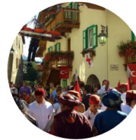
Strada de Turchia (Türk Sokağı)

Moenalılar, 300 yıldan uzun bir süredir her yıl ağustos ayında düzenledikleri festivalde Türk kültürünü yaşıyor. Türkiye'de hem resmi olarak hem de sivil toplum kuruluşları aracılığıyla festivalde varlık gösteriyor ve Moenalılara Türk kültürünü tanıtmaya çalışıyor.