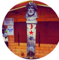
Balaban Hasan Çeşmesi